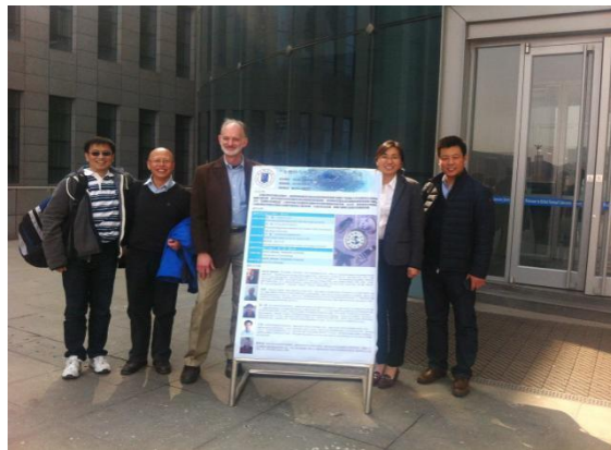
2015 年度召集省协同创新中心“生物钟与周期节律”学术研讨会

4、积极组织和参与国际、国内学术交流。全职回国工作以来，作为中国细胞生物学会理事召集并主持了 2015 年度全国大会“生物钟与周期节律”分会场。邀请海外专家 5 名，国内专家 20 多人来师大做高水平学术研讨，自己也应邀参加和做专题学术报告的有 4 次国际会议（“IPMB 国际植物分子生物学大会”“KSPB&ASPL 韩国植物生物学大会和亚洲植物脂质会议”“冷泉港国际生物钟大会”“亚洲时间生物学大会”）、“国家自然科学基金委双清论坛”、“时间生物学学术研讨会”、“中国植物生理与植物分子生物学全国学术年会”、2 届“全国植物学大会”。召集并主持 2015 年度和 2013 年度的河北师范大学“生物钟与周期节律”学术研讨会，主持并邀请来自美国范德堡大学（国际生物钟学会主席 Carl H. Johnson）、中山大学、武汉大学、中国科学院、中国农业大学、北京生命科学研究中心、西北大学的知名专家进行学术研讨。